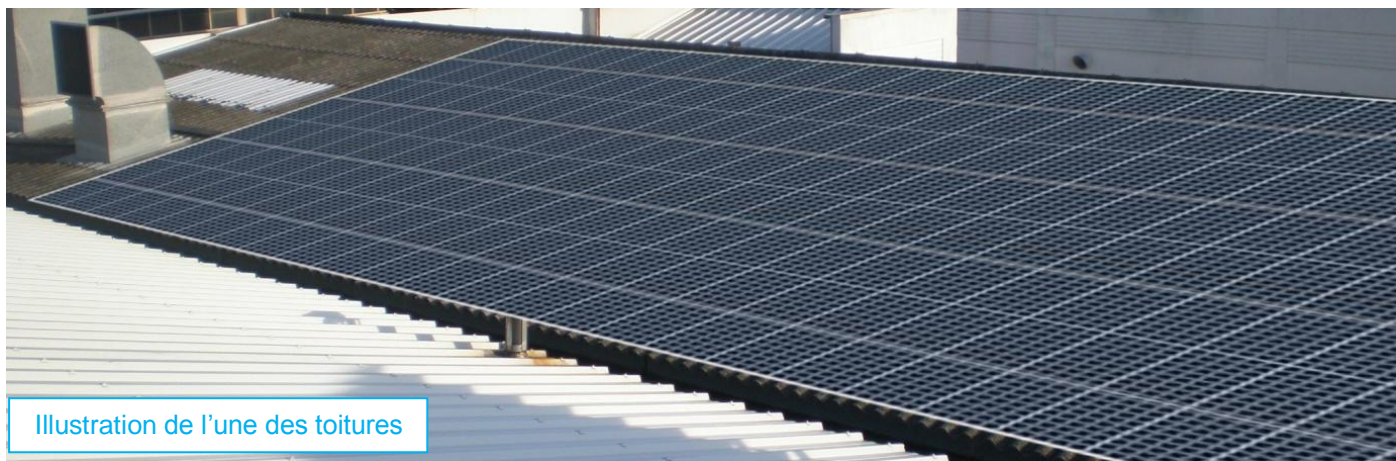
Illustration de l'une des toitures